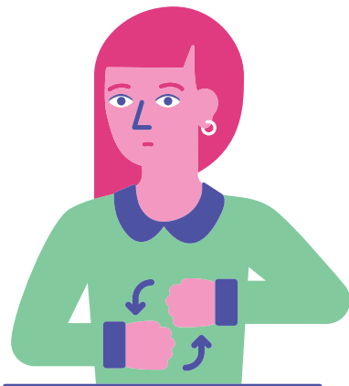
Komm zum Punkt