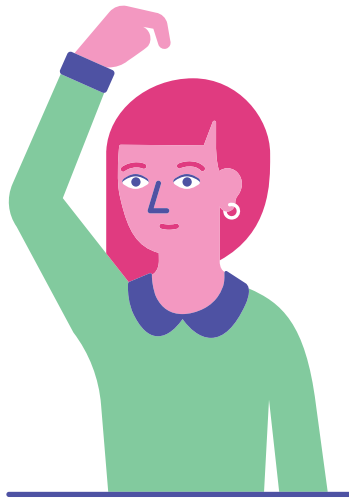
Meldung zum Punkt